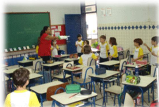
Alunos do 2º ano durante a brincadeira Point and Say na aula sobre cores

A Equipe do The Kids Club espera que o 1º Bimestre, represente só o início de um ano repleto de novas aventuras com os alunos do Ensino Fundamental.