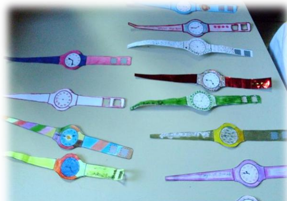
Watches confeccionados pelo 4º ano na aula sobre horas

O Quinto Ano trabalhou as nacionalidades, o vocabulário relacionado à viagens e aeroportos, além de diversos verbos.