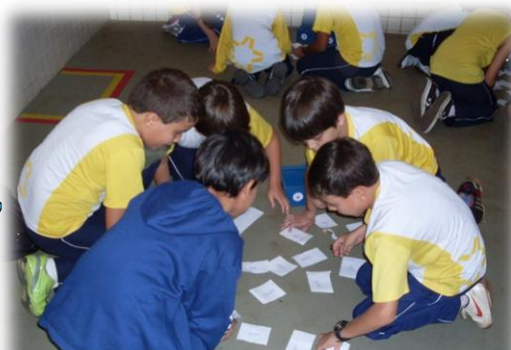
Alunos do 5º ano decifrando os mistérios do Treasure Hunt na aula sobre o verbo "to be"