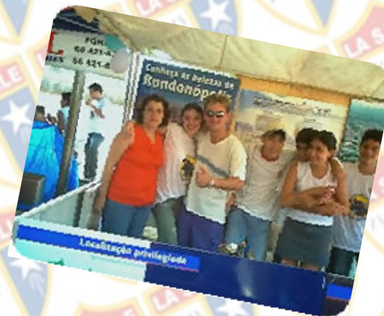
La Salle Rondonópolis