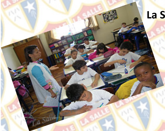
La Salle São Paulo

“Hoje estou presente em diversos estados”.