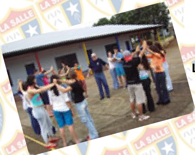
La Salle Pato Branco Paraná